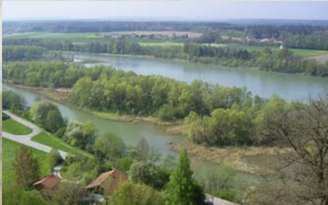
Flussauen sind bedeutende Lebensräume für die Mehrzahl der heimischen Lurche und Kriechtiere

Der LARS wurde 1980 von Amphibien- und Reptilienfreunden gegründet. Er hat sich den Schutz dieser Tiere zur Aufgabe gemacht. Sein Ziel ist es, bei politischen Entscheidungsträgern und der Öffentlichkeit mit fachlicher Kompetenz für den Erhalt und die Verbesserung der Lebensräume dieser Tierklassen einzutreten. Denn die sogenannte „Herpetofauna“ spielt im Naturhaushalt eine wichtige Rolle. Wer abwechslungsreiche Lebensräume von Tieren und Pflanzen schützt, bewahrt nicht nur Lurche und Kriechtiere, sondern auch uns eine lebenswerte Umwelt.