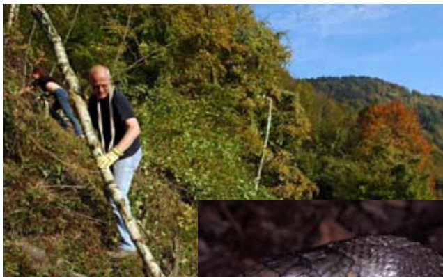
Mitglieder des LARS bei der Entbuschung des Lebensraums der Äskulapnatter bei Passau