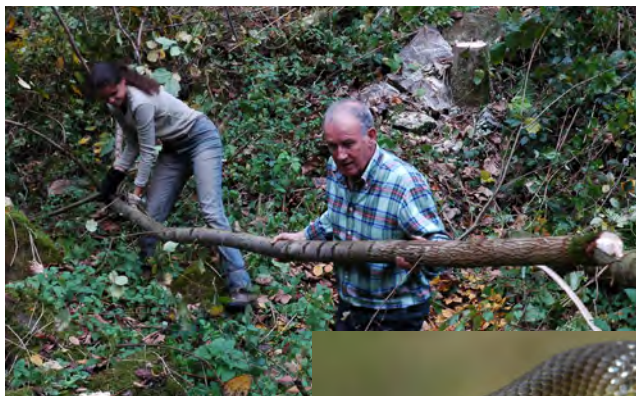
Mitglieder des LARS bei der Entbuschung des Lebensraums der Äskulapnatter bei Passau

LARS c/o Zoologische Staatssammlung Münchhausenstr. 21, 81247 München