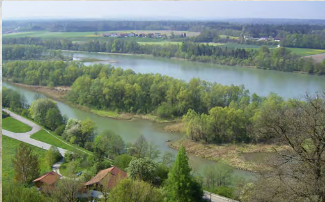
Flussauen sind bedeutende Lebensräume für die Mehrzahl der heimischen Lurche und Kriechtiere

Der LARS wurde 1980 von Amphibien- und Reptilienfreunden gegründet. Er hat sich den Schutz dieser Tiere zur Aufgabe gemacht. Sein Ziel ist es, bei politischen Entscheidungsträgern und der Öffentlichkeit mit fachlicher Kompetenz für den Erhalt und die Verbesserung der Lebensräume dieser Tierklassen einzutreten. Denn die sogenannte „Herpetofauna“ spielt im Naturhaushalt eine wichtige Rolle. Wer abwechslungsreiche Lebensräume von Tieren und Pflanzen schützt, bewahrt nicht nur Lurche und Kriechtiere, sondern auch uns eine lebenswerte Umwelt.